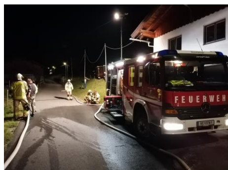
Funktionstest der neuen fix installierten Löschleitung im Rauth am 27.09.2023