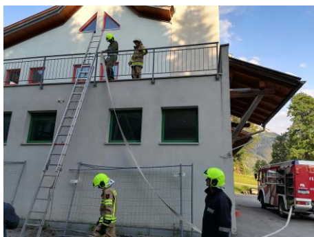
Richtiges Aufleitern am 14.06.2023

Ein paar Impressionen dürfen wir euch zeigen.