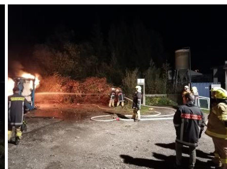
Simulation Zimmerbrand am 04.10.2023