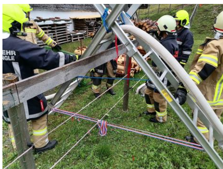
Probe am Spielplatz in der Schmitte am 05.07.2023