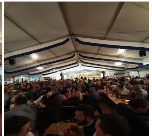
Platzkonzert der Harmonie Musik Nesselwang unsere Musikkapelle in Nesselwang