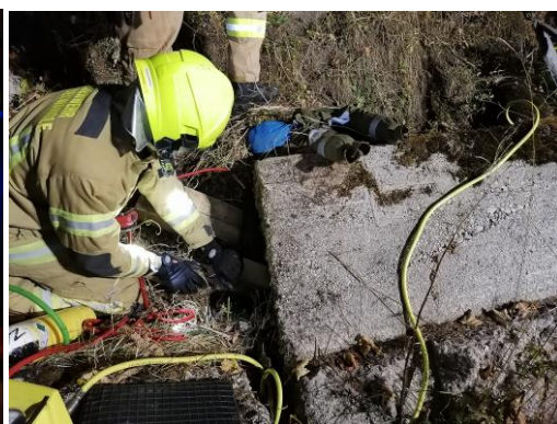
Simulation eingeklemmte Person bei der alten Säge am 11.10.2023